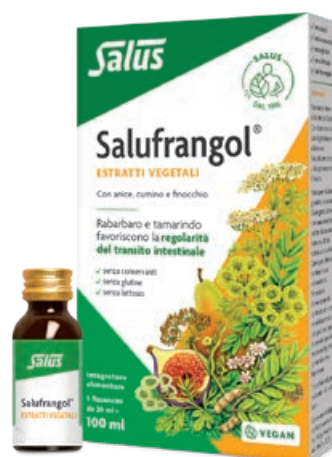
Salufrangol 5x20 ml Cod. prodotto: 504715M Prezzo: 11,95 € (IVA 10%)