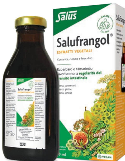
Salufrangol 250 ml Cod. prodotto: 504715 Prezzo: 22,00 € (IVA 10%)